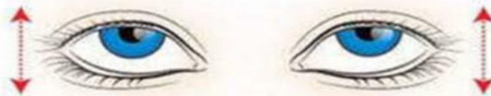
Движение глазами вертикально: вверх-вниз