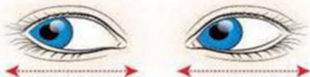
Горизонтальные движения глаз: вправо-влево